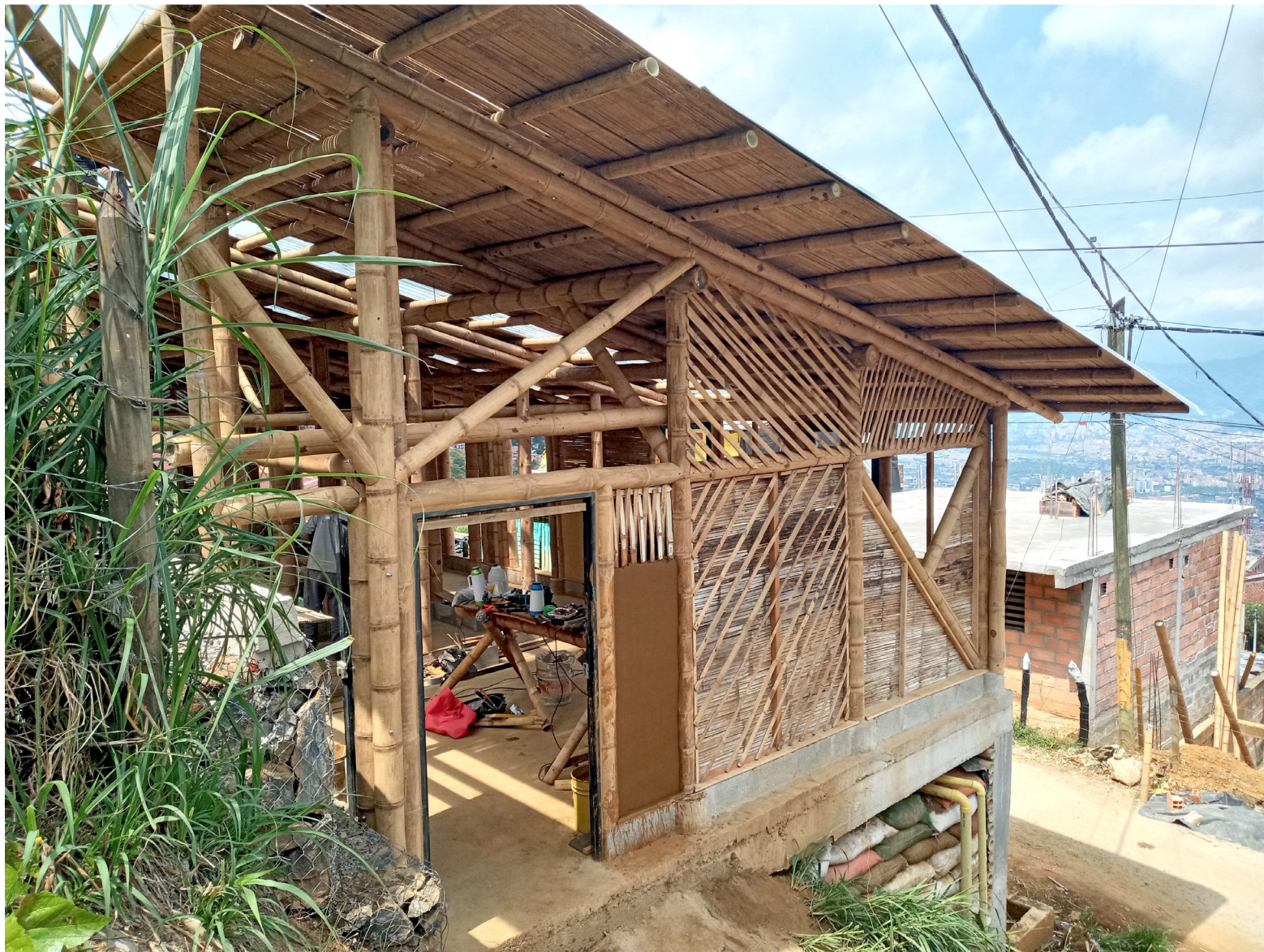
Figure 2 : Casa para la Vida en cours de construction, mai 2023, Victorine Dréau