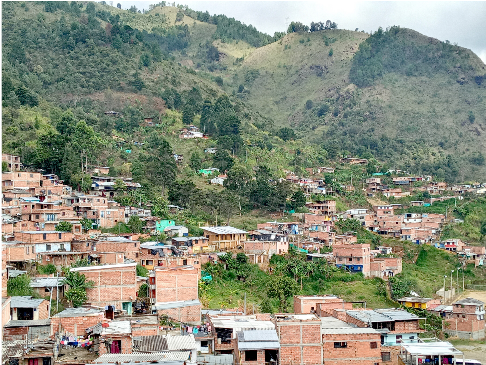
Figure 1 : Bello Oriente, juin 2023, Victorine Dréau