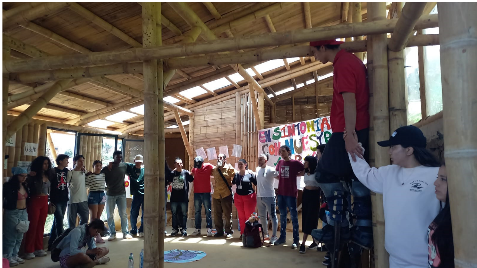
Figure 3 : Réunion du Comité Impulsor, juillet 2023, Arbol Red